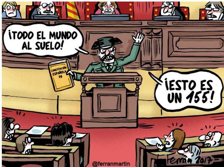
Tejero (de man van de staatsgreep van 1981) in het Catalaanse parlement: "Iedereen op de grond!" "Dit is een 155!"

Puigdemont wachtte de verdere maatregelen niet af. Zaterdag liep hij nog in zijn thuisstad Girona door een enthousiaste menigte, de dag daarna vertrok hij met diverse ministers naar Brussel. Enkel een van hen zouden naar Barcelona terugkeren, maar vier bleven er bij hem. Aanvankelijk wist men in Catalonië niet wat hier van te denken, maar uiteindelijk werd het duidelijk: Puigdemont had voorzien wat Madrid ging doen, wilde zich niet achter tralies laten zetten en koos een ballingsoord waar hij midden in het Europese gebeuren verkeerde en de Catalaanse zaak veel internationale aandacht kon geven.